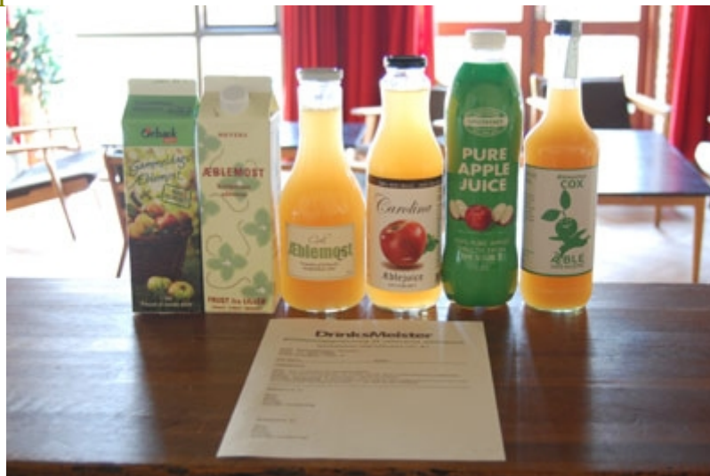
De seks forskellige æblejuicer i testen.